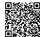
學校/團體報名表格