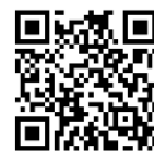
個人報名 Google Forms

個人 Google Forms： https://forms.gle/CF2Z2vnBuGKsnsUt8 (可同時上載繳費之人數紙) 或 學校/團體：於 https://drive.google.com/drive/folders/14eLDhv6ctmL4Xfa7BA75oJiXcqA3hTNt?usp=drive_link 下載 excel 表後，電郵至 info@kpge.org 後，本會把付費單郵寄到學校/團體