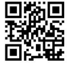
個人報名 Google Forms

填妥的申請表郵寄交回本中心：「香港灣仔 軒尼詩道 184 號 6 樓 潘先生收」 信封面註明：「大灣區資優數學競賽(香港站) 2021」 或